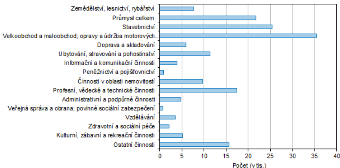
Struktura subjektů v Ústeckém kraji podle převažující činnosti k 31. 12. 2022

Z vnitroregionálního pohledu bylo k 31. 12. 2022 nejvíce ekonomických subjektů soustředěno v okresech Ústí nad Labem (29 172 subjektů, tj. 16,4 % subjektů v kraji) a Děčín (28 350 subjektů, tj. 16,0 %). Z pohledu jednotlivých právních forem nejvíce zemědělských podnikatelů působilo v okresech Litoměřice a Louny (33,0 resp. 20,5 % všech zemědělských podnikatelů v kraji). Více jak 49 % všech zahraničních osob registrovaných v kraji bylo evidováno v okresech Teplice (25,9 %) a Most (23,2 %). V okrese Most bylo rovněž registrováno nejvíce družstev (26,8 %). Téměř 40 % obchodních společností v kraji má sídlo v okresech Teplice nebo v Ústí nad Labem (20,1 resp. 19,6 %).